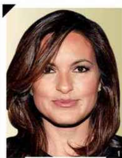
50 ans et + Mariska Hargitay

Avec l'âge, les paupières s'affaissent. On exécute donc toujours les mouvements de pinceau du bas vers le haut. Comme pour les cheveux, on préfère une couleur naturelle. Si le sourcil s'appauvrit, on lui redonne de l'étoffe en le repigmentant. S'il pousse dans tous les sens - dérèglement hormonal - on coupe aux ciseaux les petits poils qui dépassent sans tailler dans la masse.