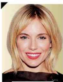
30 ans et + Sienna Miller

On a envie d'un sourcil plus sophistiqué. Après l'avoir bien brossé, on le remplit, par des petits traits hachurés, au crayon ou à la poudre, puis on fond cette ligne à la brosse pour structurer. Ensuite, on l'intensifie au mascara à sourcils. Petit truc de maquilleur pour le soir : le lustrer avec un peu de baume à lèvres transparent posé au pinceau.