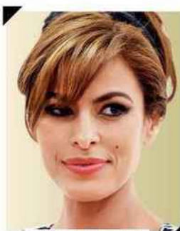
40 ans et + Eva Mendes

La ligne du sourcil dépend de la forme du visage. Quand celui-ci commence à se modifier, elle suit. On doit donc la réhausser si elle tombe, la redessiner si elle perd son caractère. La technique qui buzz : les rajouts de sourcils. Une fois définies la forme et l'épaisseur, l'esthéticienne colle chaque extension sur un poil ou sur la peau. Au final, le visage est rafraîchi, le regard plus présent.