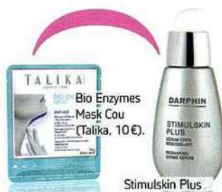
Bio Enzymes Mask Cou (Talika, 10 €).

L'hiver, pour ne pas aggraver votre épiderme, choisissez une écharpe en soie et évitez les matières irritantes comme les lainages.